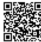
観音山フルーツガーデン