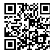
サントリーフラワーズ

https://www.suntory.co.jp/flower/company/